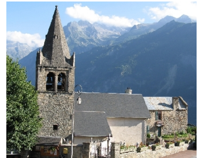
Prieuré canonial de Saint-Pierre-de-la-Garde

MSH Lyon St-Étienne 14, avenue Berthelot, Lyon 7 e Salle Marc-Bloch